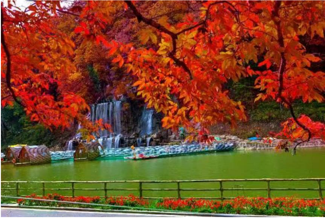
参仙谷生态旅游度假区