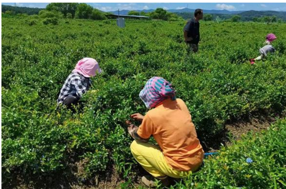
北四平蓝莓采摘基地