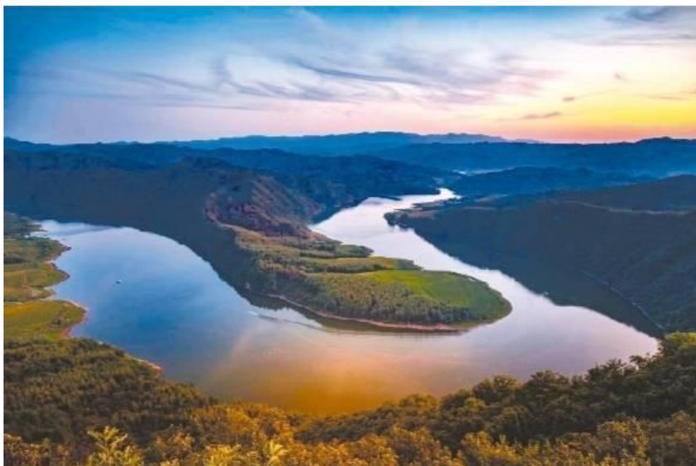
新宾满族自治县绿水（苏子河）青山生态系统

新宾满族自治县境内水资源较丰富，全县水资源总量 13.4 亿立方米，其中苏子河 6.42 亿立方米、太子河 3.93 亿立方米，富尔江 105 亿立方米。已利用水资源量 1.8 亿立方米。其中苏子河 1.1 亿立方未，太子河 0.2 亿立方米，富尔江 0.5 亿立方米。