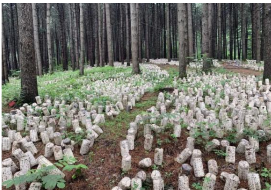
新宾林下木耳种植基地