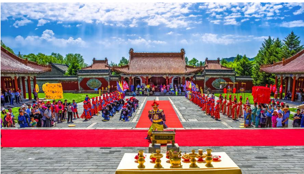
新宾县满族风情活动照片