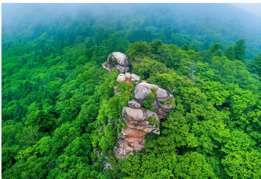
新宾满族自治县森林生态系统

新宾县森林总面积 484.84 万亩，林木蓄积量 3382.5 万立方米，覆被率 75.9%，均居辽宁省前列，拥有猴石、和睦、岗山 3 座森林公园，为辽东山区最大的森林宝库，是全国首批生态建设示范县。